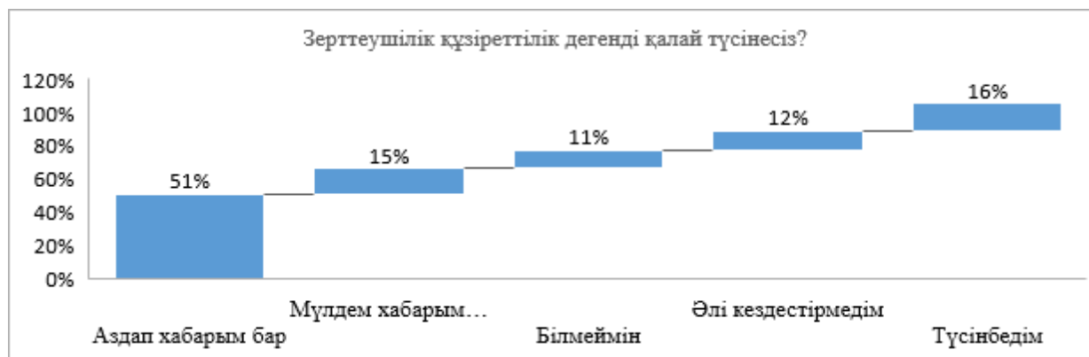
Сурет 2 – Сұрақ бойынша сауалнама нәтижелері «Зерттеушілік құзіреттілік дегенді қалай түсінесіз?»

«Зерттеушілік құзіреттілік дегенді қалай түсінесіз?» сауалнама нәтижесі бойынша барлық қатысқан білімгерлер жауап берді. Аздап хабарым бар жауабы бойынша 51%, мүлдем хабарым жоқ жауабын 15%, білмеймін жауабы бойынша 11%, әлі кездестірмедім 12%, түсінбедім жауабын 16% беріп отыр. Осыдан байқауымызға болады және әлі де болашақ мамандардың зерттеушілік құзіреттіліктерін дамытуда кедергілер орын алады.