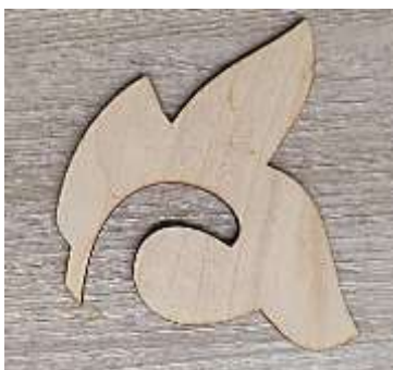
Рисунок 2 – Заготовка броши из фанеры, вырезанный на лазерном станке

Как основа брошек используется фанера, которая вырезается на лазерном станке по заранее разработанному дизайну [7]. Этот процесс обеспечивает высокую точность и детализацию изделий, что позволяет создавать уникальные и сложные формы для брошек. Лазерный станок обеспечивает быстрое и эффективное вырезание материала, что делает производство брошек более эффективным и качественным. На рисунке 2 изображены заготовка броши из фанеры, вырезанный на лазерном станке.