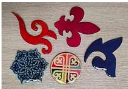
Рисунок 4 – Процесс окрашивания броши акриловыми красками

После окраски брошек акриловыми красками следует процесс заливки их эпоксидной смолой. Этот шаг не только обеспечивает защиту поверхности брошек, но и придает им блеск и глянец. Эпоксидная смола создает прозрачное покрытие, которое защищает дизайн от повреждений и сохраняет его яркость на долгое время [8]. Кроме того, благодаря эпоксидной смоле брошки становятся более прочными и устойчивыми к воздействию окружающей среды. Пример показано на рисунке 4.