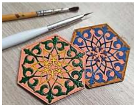
Рисунок 3 – Процесс окрашивания броши акриловыми красками

После вырезания основы на лазерном станке следует перейти к этапу окраски. Для этого используются акриловые краски, которые помогают создать разнообразные текстуры и оттенки на поверхности брошек. Окраска акриловыми красками позволяет добавить глубину и объемность дизайну, а также подчеркнуть его уникальные детали и элементы. Каждая брошь может быть окрашена в разные цвета и оттенки, чтобы создать интересный и красочный внешний вид. Процесс окрашивания броши показано на рисунке 3.